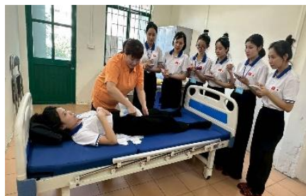
いずれの写真も「矢那梅の香園」介護職員による介護技術講義の様子