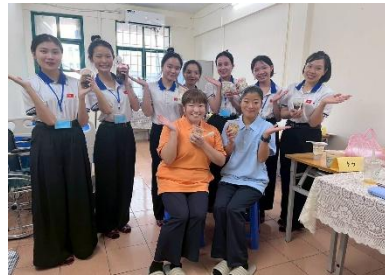
受講した学生達との一コマ (休憩中の団欒の様子)