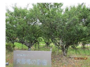
梅の香園にある梅の木です。今年もジュース作りできるかな♪

5月は「いちご狩り」「こいのぼり」「母の日」と季節を感じられる行事が多く、利用者様の笑顔が沢山見られて、楽しい月になりました。6月も梅雨に負けず過ごせるように、行事を計画しています。お楽しみに！ (文責 古泉)