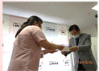
新卒職員への辞令交付の様子