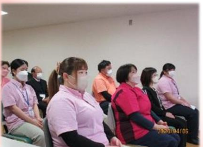
当日出席の新卒職員並びに昇格者の皆様