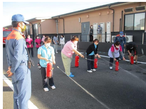
消火器取り扱い訓練