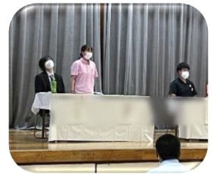
ピンクの制服が法人職員です。