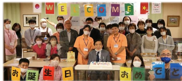
これからよろしくお祈いします!

皆様こんにちは!!(^)/ 常日頃より、「梅香会だより」をご覧いただきありがとうございます。先月号(令和8月・9月号)にも記載させて頂きましたが、コロナ禍の影響により、その入国が遅れておりました「ベトナム人介護実習生4名(木更津東邦病院かもめグループ様実習生2名、当梅香会実習生2名)」の皆様が、約2年間の待機期間を経て、ようやく日本に入国することが出来ました。令和4年10月1日から、いよいよ、当法人施設の「いわね潮の香園」での勤務開始となりました。また、就業前日の9月30日には、「木更津市(市長さん、副市長さん)への表敬訪問」も行い、気持ちも新たに、「日本(木更津市)での新生活スタート」を向かえることができました。表敬訪問後は、これからの勤務地でもある「いわね潮の香園」職員による、ウェルカムパーティが開催され、施設職員との交流を図って頂くことができました。実習生の皆様は緊張している様子でしたが、当日の日本語での挨拶は意気込みを感じ取ることができ、当法人としても、今後更に実習生の皆様が介護技術等を理解しやすいよう、そして働きやすい職場になるよう努めていかなくてはならないと改めて実感致しました。これからは「ベトナム人介護実習生」皆様と我々日本人スタッフも共に成長させて頂き、併せてご入居者様皆様にも心温まるサービスを更に行わせて頂きたいと強く思いました。実習生の皆様、共に頑張っていきましょうね!!