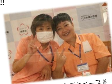
デイサービスの主任とピースめ