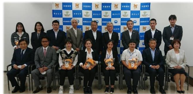
木更津市長さん・副市長さんへの「表敬訪問」