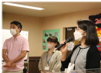
潮の香園施設長より歓迎の挨拶