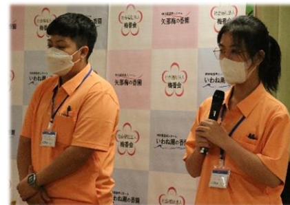
実習生より日本語での挨拶