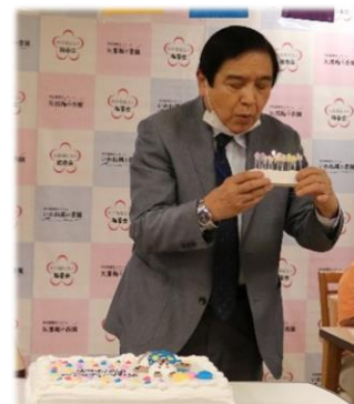
ウェルカムパーティで理事長のバースデーをサプライズしました!!