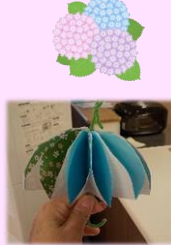
折り紙で可愛い傘を作りました ☂