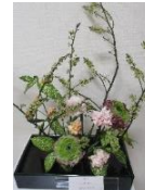
今月の生け花です。