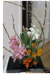
今月の生け花です。