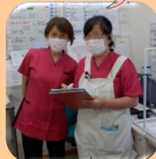
可愛い制服が似合う看護師