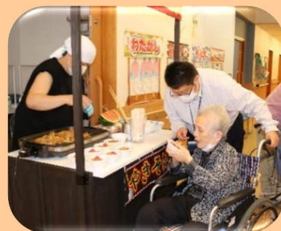
美味しい焼きそばいかがですか？