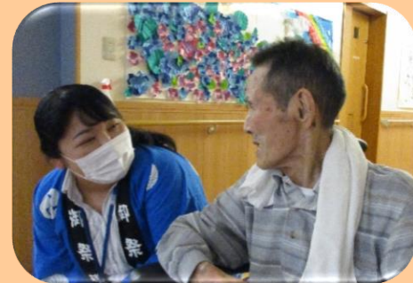
利用者様に寄り添う相談員