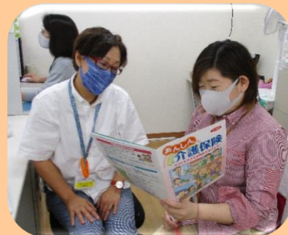
頼りになるケアマネジャー