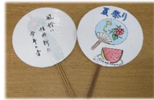
手作りうちわです！