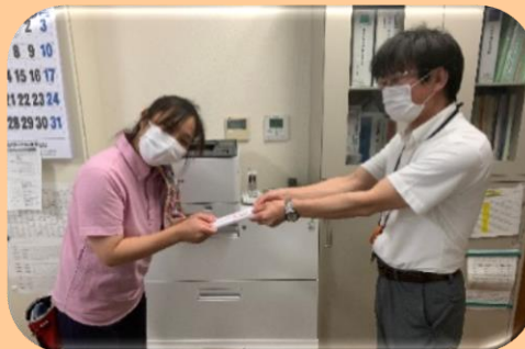
5年勤続お疲れ様でした!!