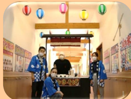
お祭りならお任せメンバー!?