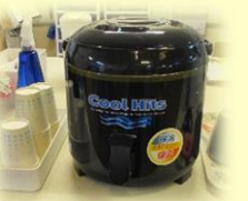
各ユニットにご自由に水分補給が出来るようにジャグを用意しています。