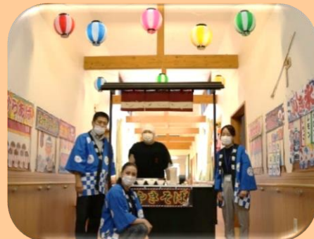
お祭りならお任せメンバー!?