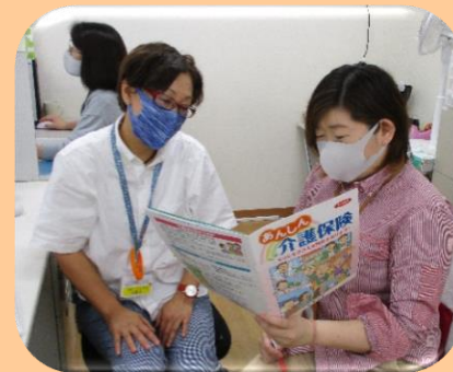
頼りになるケアマネジャー