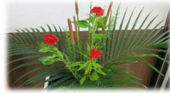
今月の生け花です。