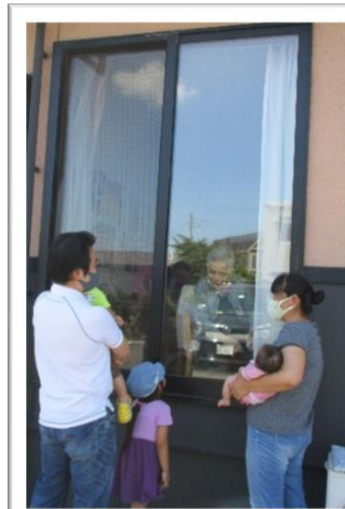
いわね潮の香園での窓越し面会の様子