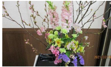
今月の生け花には桜が春ですね。