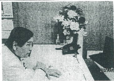
木更津市は、ベトナム社会主義共和国ダナン市と、スームによる初の面接会を実施した。

たWEB面接会とし、「木更津市役所駅前庁舎八階市長応接室」(金田クリック重城)、「梅香会」、「ダナン市・プリリアントホテル」の三つの会場を結んで行われ、同面接会では木更津市とベトナム国ダナン市などの行政的バックアップが実現した。面接会には木更津市内の介護事業者(社会福祉法人梅香会、医療法人社団邦清会、かもめグループ)二介護事業所が参加した。