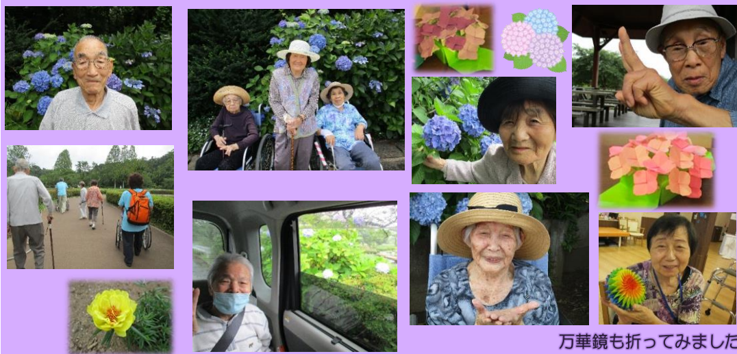
万華鏡も折ってみました。

6月18日～何日かに分けて、袖ヶ浦公園に紫陽花を鑑賞しに行ってきました。予定をしていた日があいにくの雨で、車の中からの鑑賞になってしまった方もいらっしゃいますが「雨に濡れた紫陽花もまたいいわね。」とおっしゃられていました。散歩をしながらの鑑賞は、「私の顔よりも大きいわ～」などと会話も弾み、お花の綺麗さに自然と笑顔になられる方が多く、お花に癒されました。紫陽花を思い出しながら、折り紙で立体的に折ってみました。