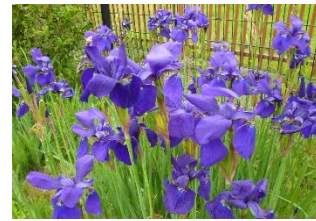
梅の香園に咲いている菖蒲