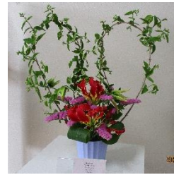
職員が生けたお花です。♡型可愛いです。