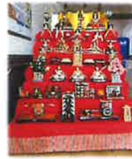
玄関ホールにお雛様を飾りました。