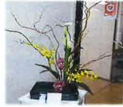
職員が生けたお花です。